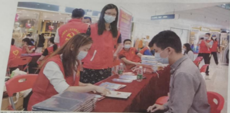
昨日，三水区委国安办在三水新动力广场开展全民国家安全教育日宣传活动，图为志愿者在为群众答疑。