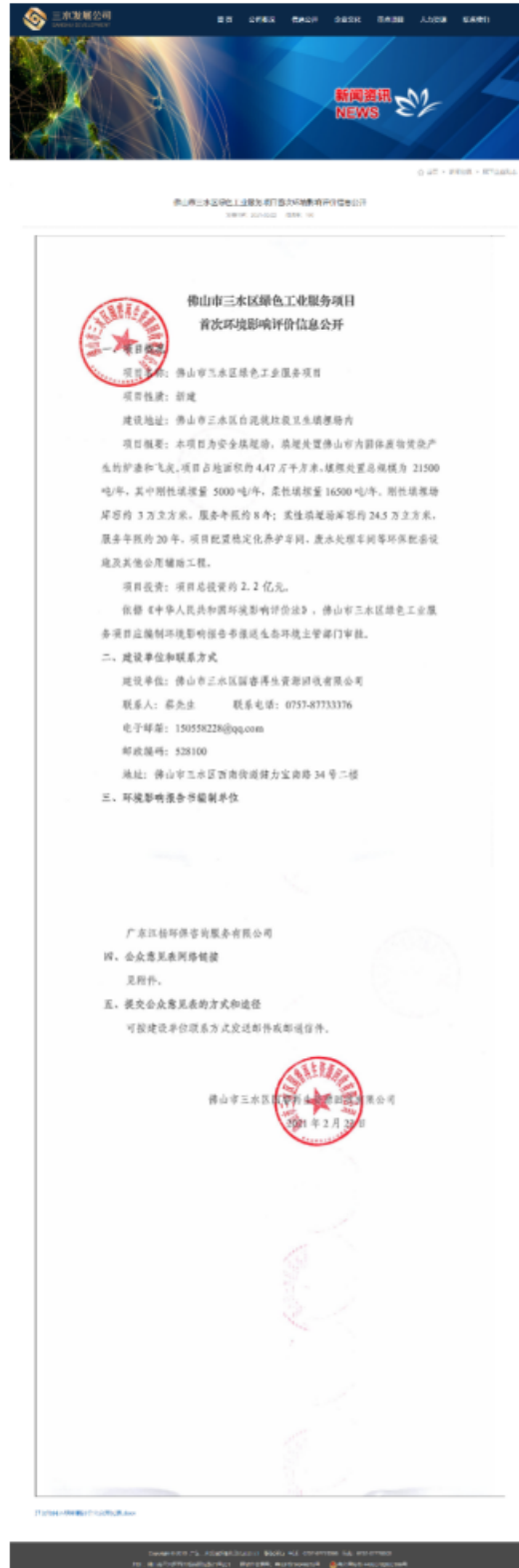
图 2-1 首次环境影响评价信息公开截图